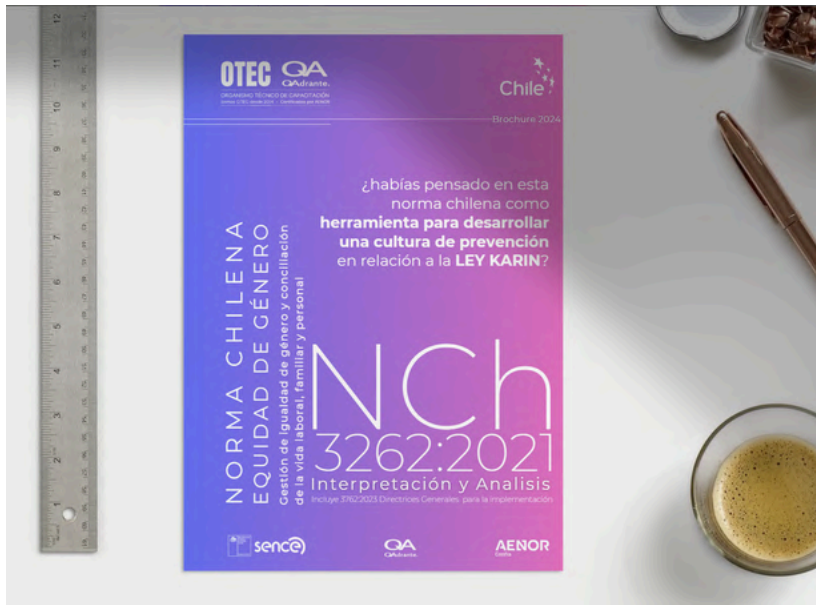
Manual del Curso